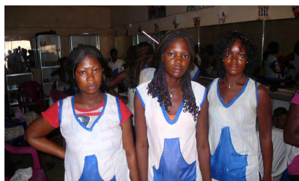
Apprenties en coiffure