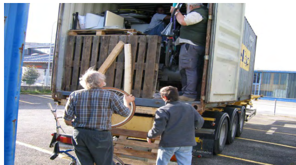
Chargement du container

La finalité est que ces apprentis-es deviennent autonomes grâce à un système de formation continue et durable. Les maîtresses et maîtres d'apprentissage donnent une base d'alphabétisation et d'initiation à la gestion d'un atelier durant l'apprentissage. KUU TINAA Conakry accompagne les apprentis-es formés-es pour leur insertion dans la vie professionnelle. Les apprentis-es certifiés-es qui le désirent pourront se mettre à leur compte et bénéficier d'une aide financière de KUU TINAA Conakry sous forme de microcrédit. De plus, dans le but de consolider les apprentissages, KUU TINAA Conakry développe ses relations avec les autorités pour faire reconnaître ces formations par l'État, étant précisé que ces certifications sont reconnues par les professionnels de la branche économique concernée.