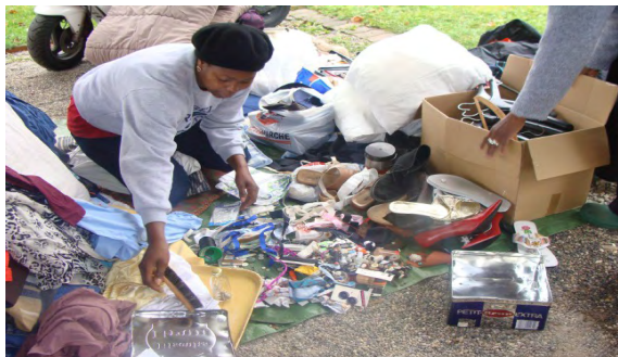
Tri du matériel reçu

Depuis sa création, KUU TINAA Genève récupère du matériel, vêtements, livres, machines à coudre des ordinateurs et imprimantes. En novembre 2010, en collaboration avec le SIT, 230 colis de matériel ont été acheminés par container à Conakry et réceptionnés sur place.