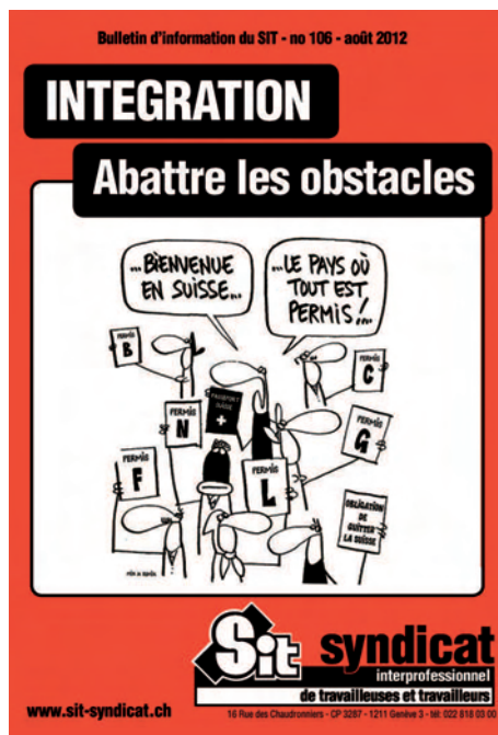
Couverture de la brochure sur ce sujet, qui est disponible auprès du secrétariat SIT.

Depuis des années, les assurances sociales sont l'objet d'attaques qui conduisent à de constantes diminutions des prestations. Il est aujourd'hui très difficile à un-e travailleur-euse accidenté-e ou malade sur une longue durée d'obtenir une rente complète de l'assurance invalidité (AI) ou du 2 e pilier. Alors que cette rente est la seule source de revenu qui permette de (sur)vivre sans devoir faire appel à l'aide sociale. Or, nombreux-euses sont les salarié-e-s étrangers-ères au bénéfice d'une autorisation de séjour qui, selon la Loi sur les étrangers, peut être révoquée en cas de dépendance à l'assistance publique. Les travailleurs-euses immigré-e-s atteint-e-s de façon durable dans leur santé ont non seulement des fins de mois très difficiles, alors même qu'ils-elles ont cotisé durant des années, mais en plus ils-elles risquent l'expulsion à cause de leur dépendance à l'aide sociale.