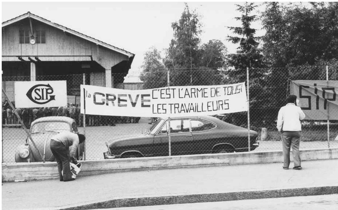
Grève à la SIP, 11 juin 1976

En juillet, le SIT commémore les 100 ans de la création des syndicats chrétiens de Genève. Quel rapport? L'histoire d'un changement de nom et d'idéologie.