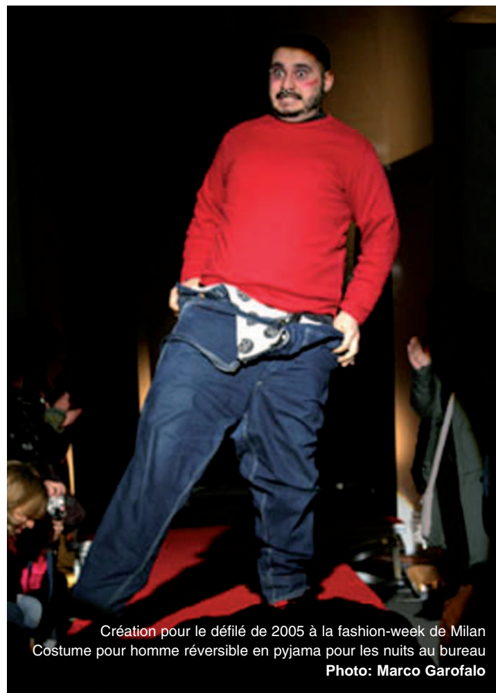
Création pour le défilé de 2005 à la fashion-week de Milan Costume pour homme réversible en pyjama pour les nuits au bureau

Depuis 2005, le mouvement se développe en un volet marque libre et reproductible qui garde le nom de Serpica Naro (www.serpicanaro.com) et un volet syndical plus classique en fournissant un service d'assistances et des permanences juridiques pour les précai-