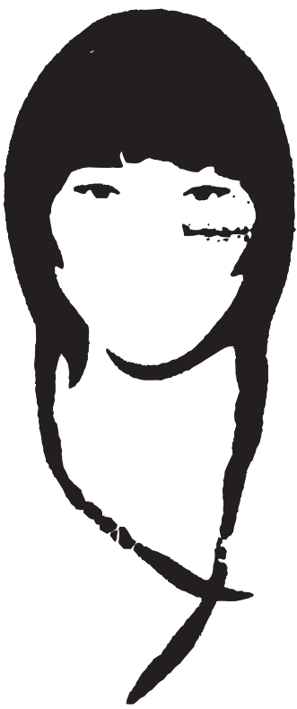
Le logo du syndicat San Precario "Donne-nous du travail et la protection sociale"!