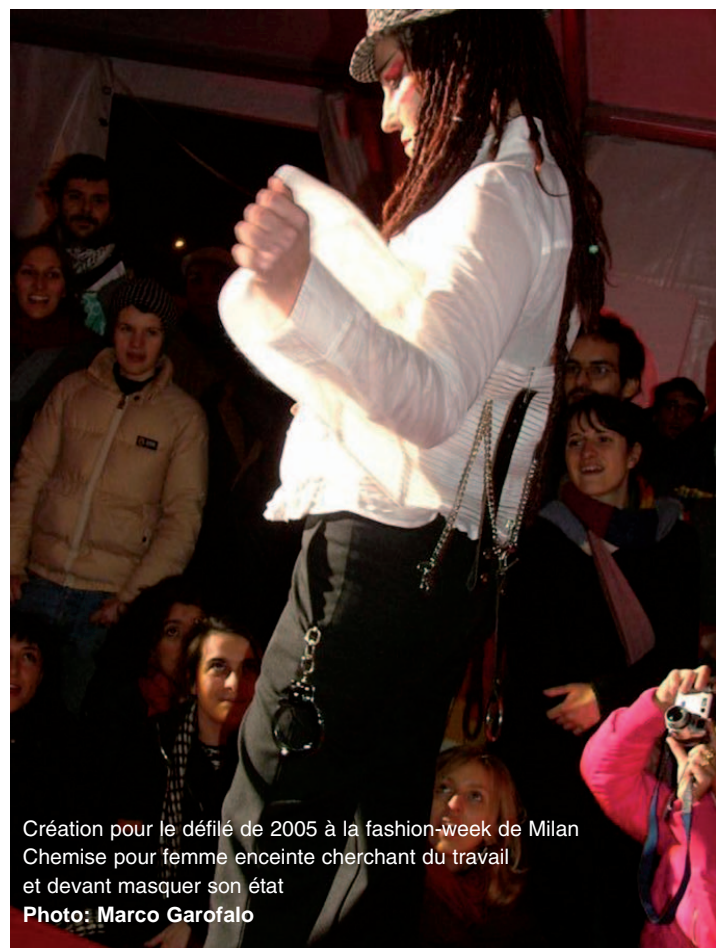
Création pour le défilé de 2005 à la fashion-week de Milan Chemise pour femme enceinte cherchant du travail et devant masquer son état

Le monstre canular a été rendu possible par la participation bénévole de 200 jeunes précaires, dont beaucoup à leur première action politique. San Precario, selon Zoé, graphiste désormais avec un contrat à durée indéterminée et une des forces de ce syndicat, est né en marge des partis et syndicats traditionnels qui ne s'occupent jamais sérieusement des travailleurs-euses précaires. San Precario est né pour sortir les précaires de leur isolement et atomisation et dans des métiers où il est impossible de s'organi-