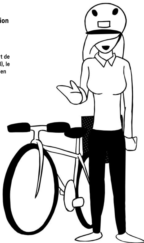
Illustration Ridlet Mise en page Mathilde Veuthey

Pour une entreprise sans harcèlement sexuel: un guide pratique Ducret, V., 2008, 2 e édition. Georg éditeur.