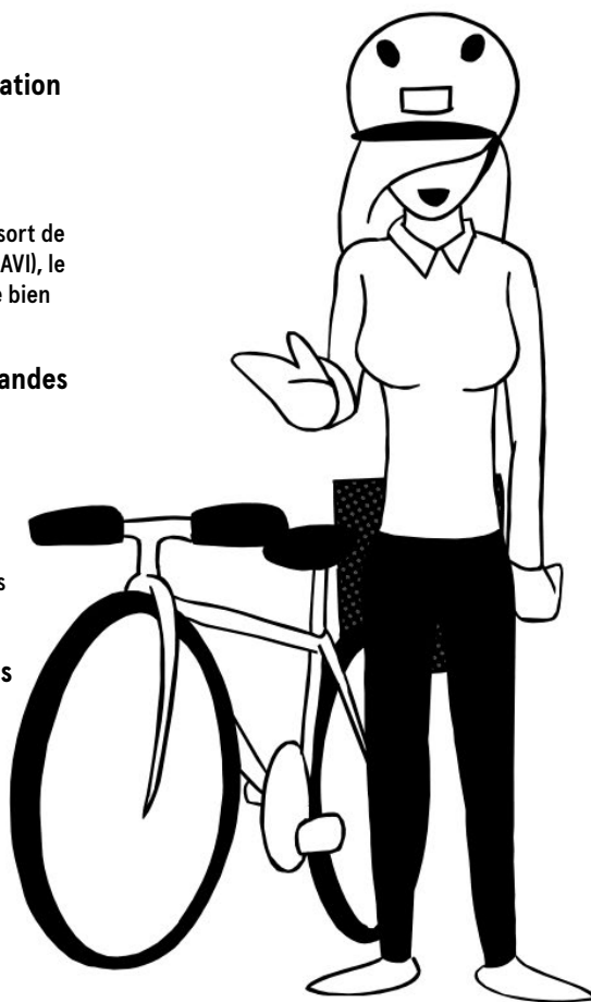
Illustration Ridlet Mise en page Mathilde Veuthey

Pour une entreprise sans harcèlement sexuel : un guide pratique. Ducret, V., 2008, 2 e édition. Georg éditeur.