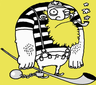
CRIMINEL SUISSE de chez Suisse