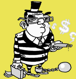
CRIMINEL TIP TOP