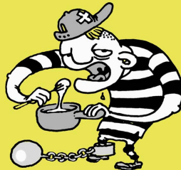
CRIMINEL Bien de chez NOUS