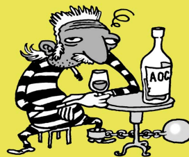
CRIMINEL TYPIQUE DU coin